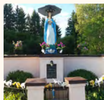
Figura przydrożna z 1882 r. - przedstawienie postaci Matki Bożej. Figurę postawił na pamiątkę swojej obecności w Pogorzeli ówczesny właściciel wsi Mikołaj Wisłocki.

Figura przydrożna Trójcy Świętej zwana „Tronem Łaski” z pocz. XIX w.