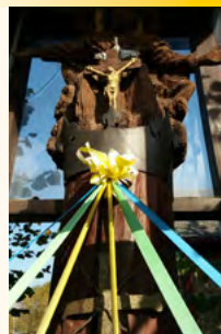
Figura umieszczona na wysokim, okorowanym pniu z drzewa dębowego. Dominuje postać Boga Ojca siedzącego na tle obłoków z rozłożonymi w bok rękoma. U stóp Boga Ojca - Chrystus rozpięty na krzyżu, na piersiach - srebrzysta gołębica z rozpostartymi skrzydłami. W Pogorzeli podobno było aż 14 takich figurek rozlokowanych na krańcach wsi. Miały one chronić Pogorzel przed wybuchną w tym czasie epidemią cholery.

Figura przydrożna Trójcy Świętej zwana „Tronem Łaski” z pocz. XIX w.